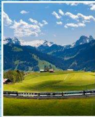
GOLDEN PASS LINE Montreux-Zweisimmen