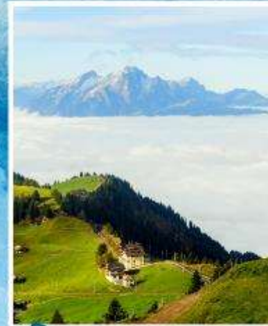
RIGI KULM Queen of the Mountains