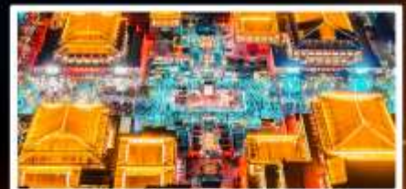
ถนนวัฒนธรรมต้าถิง