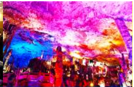
ถ้ำแก้วสวรรค์วิเวกเทียนถัว