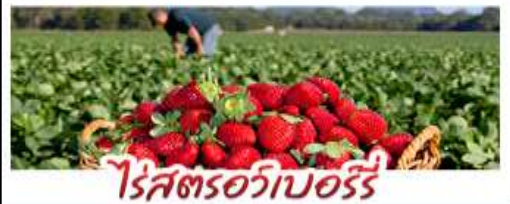
ไร่สตรอเบอร์รี่

คฤหาสน์เหวินเจิง - สวนซากุระชิงเต่า ไร่สตรอเบอร์รี่ - โรงเบียร์ชิงเต่า