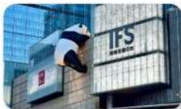
แพนด้าป็นตัก IFS