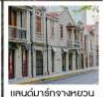
แลนด์มาร์กจางหยวน

เซี่ยงไฮ้ คาสสิก ไนท์ / 3 ดึกใหญ่แห่งเซี่ยงไฮ้ คองเรือหมู่บ้านโบราณจูเจียเจียว / EKA Tianwu / วัดหลงหัว แลนด์มาร์ก จางหยวน / ถนนหวยไห่ / ชมโชว์ ERA ที่โรงละครโด่งดังระดับโลก / ซินเทียนตี้