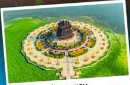
วัดคงทอง