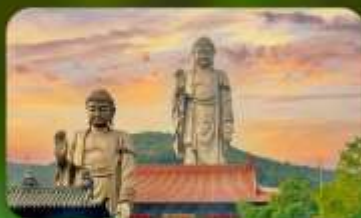
พระใหญ่หลิงชาน