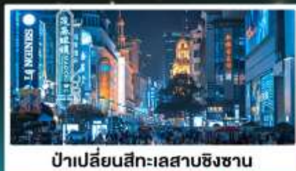
ป่าเปลี่ยนสีทะเลสาบชิงชาน