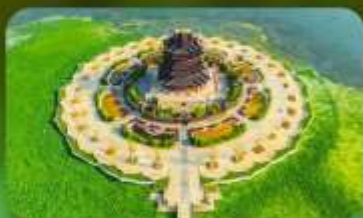
วัดฉงหยวน