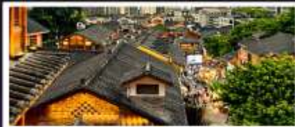
เมืองโบราณสี่ปาที้