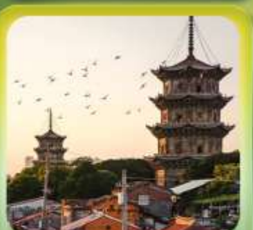
"เมืองโบราณฉวนโจว"