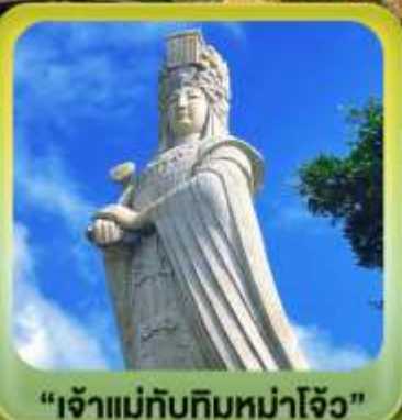
"เจ้าแม่กิมกิมม่าโจ้ว"