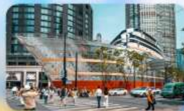
เรือทลยส์วิตคอง