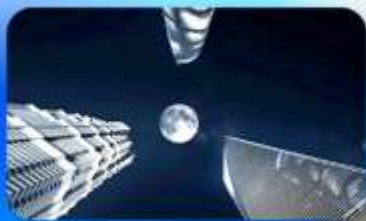
ลู่อิจัยσύ