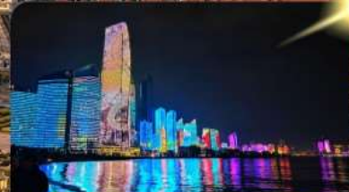
หาด No.3 Bathing

เมนูพิเศษ อาหารซีฟู้ด 6 วัน 4 คืน เดินทาง : พ.ค. – มิ.ย. 69