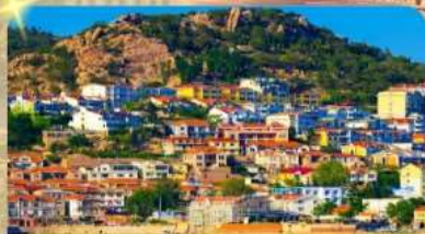
ถ่ายภาพซาจือໂຂ່