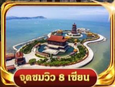
จุดชมวิว 8 เขียน