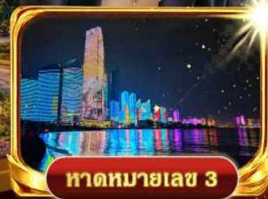
หาดหมายเลข 3