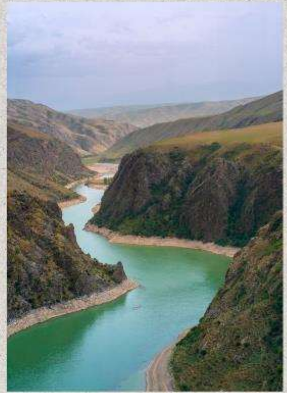
แกรนด์แคนยอนคูโคซู