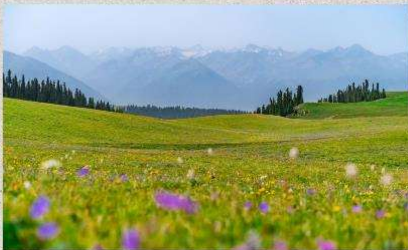
ทุ่งหญ้าคารา