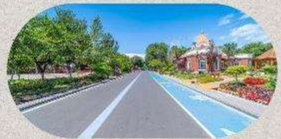
หมู่บ้านโบราณอุยกูร์คาจันจี