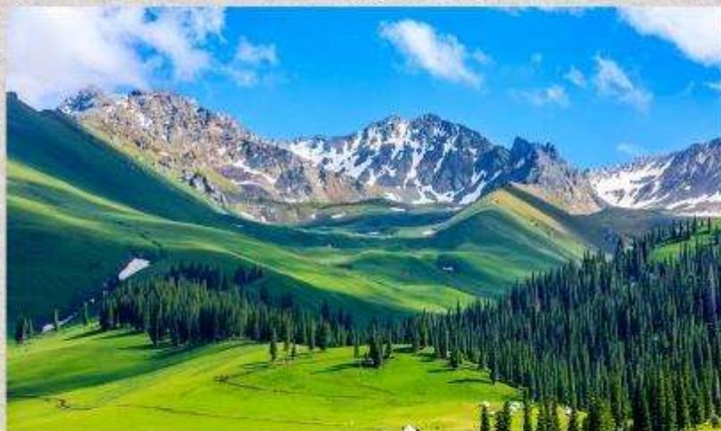
ทุ่งหญ้านาลากี