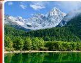
อุทยานπίงฝงโกว