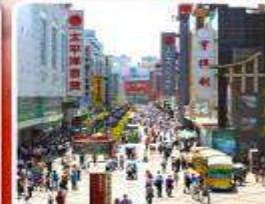
ช้อปปิ้งถนนคนเดินชุนซีลู่