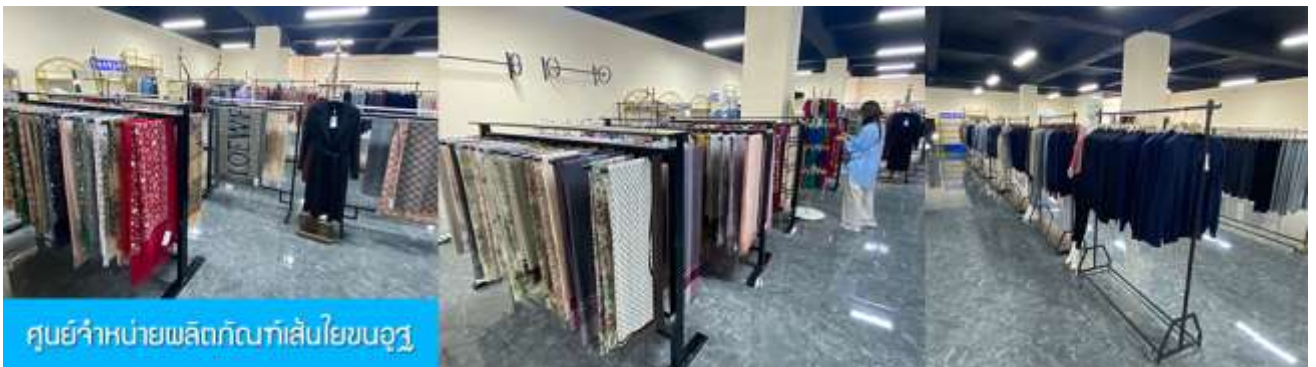
ศูนย์จำหน่ายผลิตภัณฑ์กลับโยนจวู

พักที่ ORDOS GLASSLAND MONGOLIAN YURT เป็นห้องพักสไตล์มอโกเลียน (กระโจม)