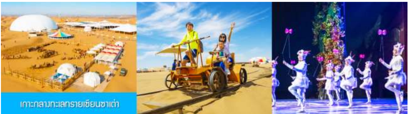
เกาะกลางทะเลทรายเขียนซาเต๋า