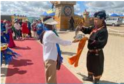
พิธีต้อนรับแขกด้วยเหล้า

เที่ยง รับประทานอาหารกลางวัน ณ ร้านอาหารพื้นเมืองในเขตอุทยาน (8)