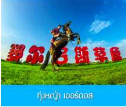
ทุ่งหญ้า เออร์ดอส