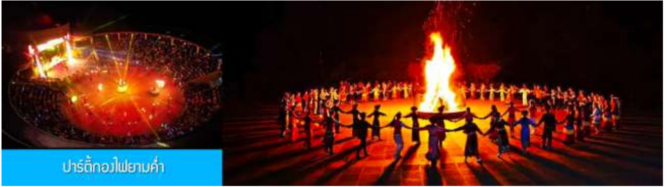
ปาร์ตี้กองไฟยามค่ำ