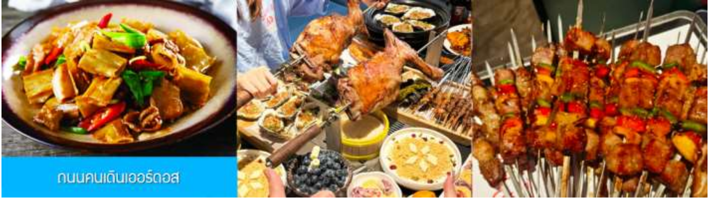
ถนนคนเดินเออร์ดอส

นำท่านเที่ยวชม สวนวัฒนธรรมหมงู่หยวนหลิว 蒙古源流 เป็นอุทยานท่องเที่ยวเชิงประวัติศาสตร์และวัฒนธรรมระดับ 4A ของจีน ที่เป็นต้นกำเนิดของชนชาติและวัฒนธรรมมองโกล สะท้อนความเป็นจักรวรรดิที่ยิ่งใหญ่เมื่อ 700 ปีก่อน ชม ประตูงเทียน 崇天门 สุคมโหฬารที่แสดงถึงความยิ่งใหญ่ของจักรวรรดิมองโกล ชม จัตุรัสเถิงเก้อหลี่ 腾格里广场 จัตุรัสกลางแจ้งขนาดใหญ่ที่ใช้ประกอบพิธีกรรมต่าง ๆ