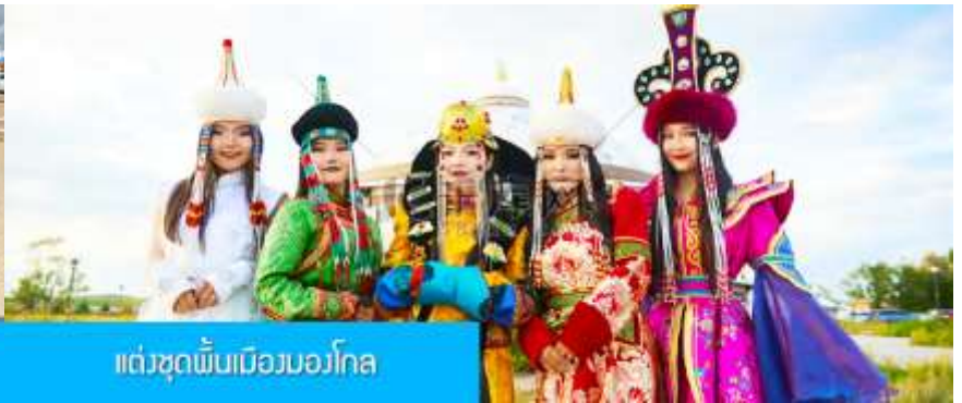
แต่งชุดพื้นเมืองมองโกล