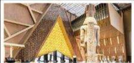
พิพิธภัณฑ์แกรนด์อียิปต์(GEM)

อารยธรรมลุ่มแม่น้ำไนล์ - พีรามิด - อเล็กซานเดรีย - แมมฟิส - ไคโร - โรงแรมระดับ 4 ดาว รวมค่าวีซ่า ตะลุยกะเลทราย - อาหารครบทุกมื้อ