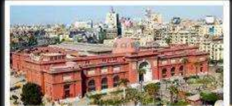
พิพิธภัณฑ์สถานแห่งชาติอียิปต์