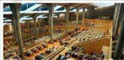
ห้องสมุดอเล็กซานเดรีย