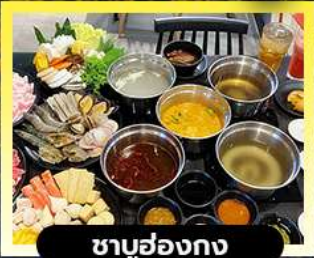
ซาบูฮ่องกง