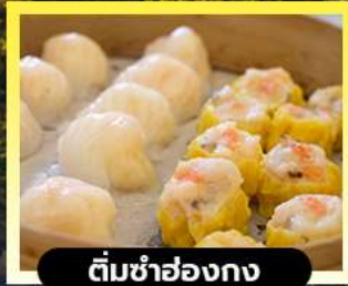
ตีมซ่าฮ่องกง