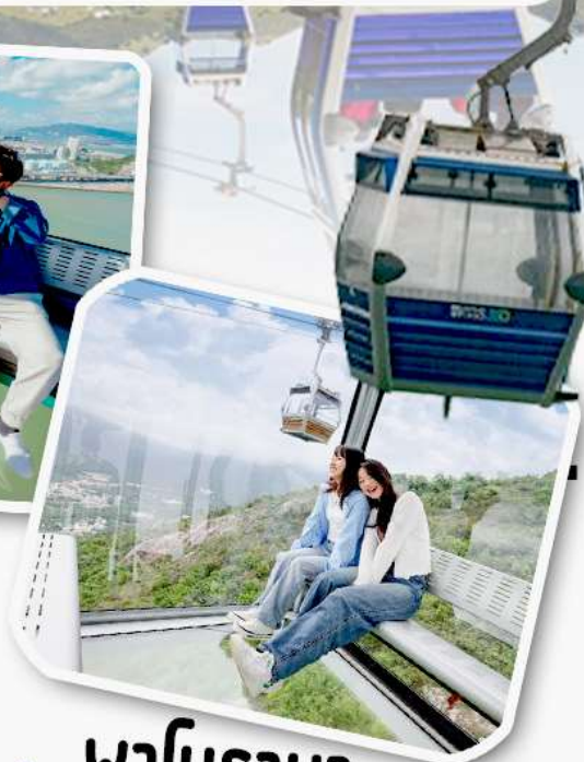
พานิราม่า