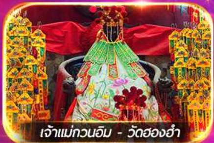
เจ้าแม่ทวนอิม - วัดฮ่องกง