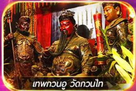
เทพทวนอู วัดกวนไท

พามุไหว้พระขอพร 8 วัดดัง เล่นเครื่องเล่นดิสนีย์แลนด์เต็มวัน ชมพลุสุดอลังการ