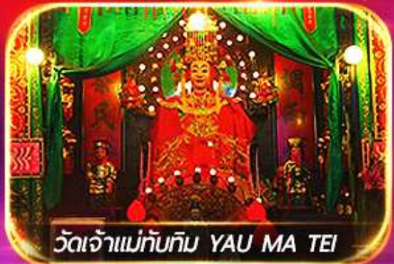
วัดเจ้าแม่ทับทิม YAU MA TEI