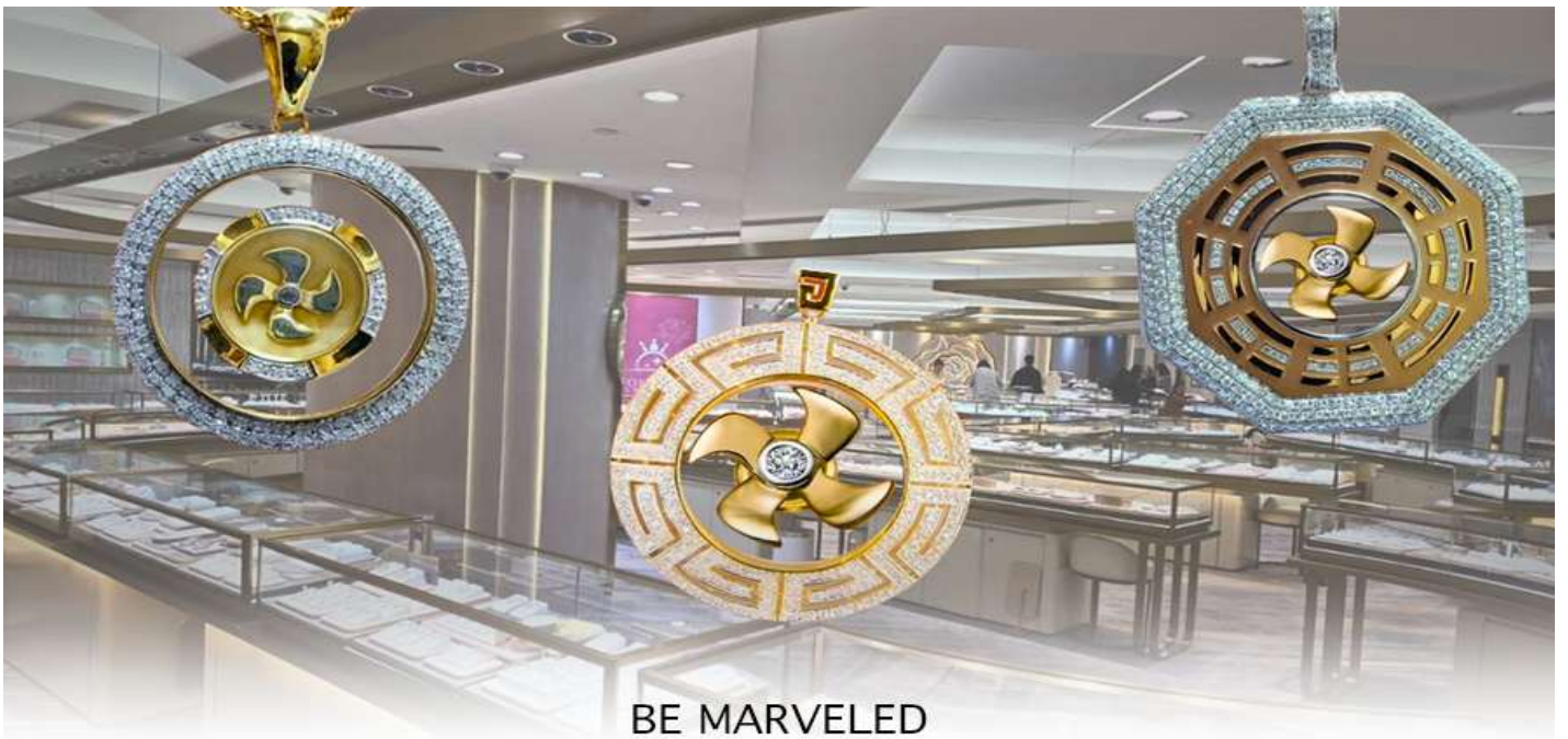
BE MARVELED ศูนย์ฮวงจุ้ย กัททันเศรษฐี

นำท่านชม ศูนย์ฮวงจุ้ย กัททันเศรษฐี ที่ขึ้นชื่อของฮ่องกง ท่านจะได้พบกับงานดีไซน์ที่ได้รับรางวัลยอดเยี่ยม และใช้ในการเสริมดวงเรื่องฮวงจุ้ย โดยการย่อใบพัดของกังหันที่เป็นสัญลักษณ์ของวัดวัดเซ่งหิมิว มาทำเป็นเครื่องประดับ ไม่ว่าจะเป็นจี้, แหวน, กำไล หรือต่างหูเพื่อเป็นเครื่องประดับติดตัว และเสริมดวงชะตา ซึ่งสินค้าทุกชนิด มีเอกสาร รับประกันคุณภาพเปลี่ยนหรือซ่อม ได้ตลอดอายุการใช้งาน หากเกิดการชำรุดจากสินค้าไม่ใช่อุบัติเหตุ