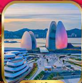
Zhuhai Opera House