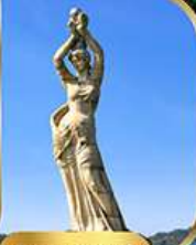
จูไห่ฟิชเชอร์ทรี