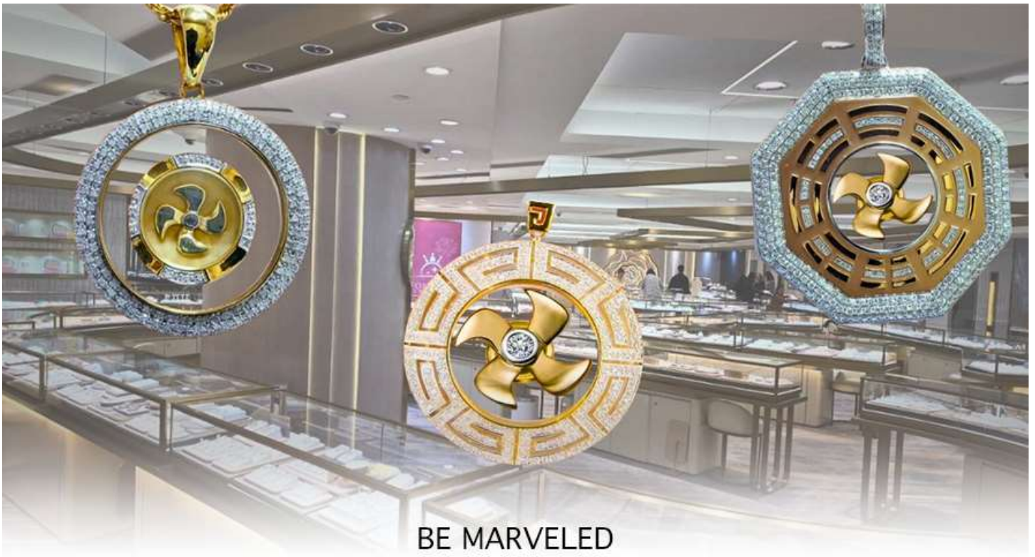
BE MARVELED ศูนย์อวรุญย์ กัหวันเศรชฐ์

และนำท่านชม ศูนย์ปี่เซี่ยะ ซึ่งคนจีนนั้น ถือว่าหยกเป็นหิน ที่เป็นตัวแทนของความสวยงามและความบริสุทธิ์มีความเชื่อว่าหยก มงคล ถ้าพกติดตัวไว้จะอายุยืนและสุขภาพดีมีสินค้ามากมายเกี่ยวกับหยก อาทิ กำไลหยก หรือสัตว์นำโชคอย่างปี่เซี่ยะ ให้ท่านได้เลือกซื้อเป็นของฝาก, ของที่ระลึก หรือของนำโชคแต่ตัวท่านเอง