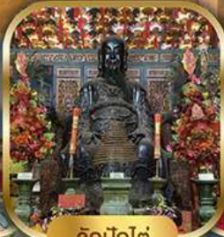
วัดปึกใต้