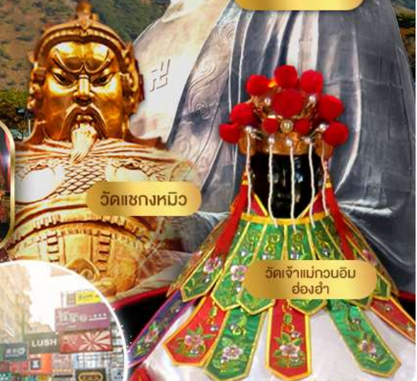
วัดแซกงหมิว