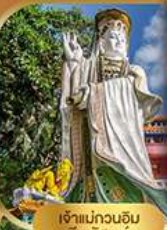
เจ้าแม่กวนอิม รวิฬสเบย์