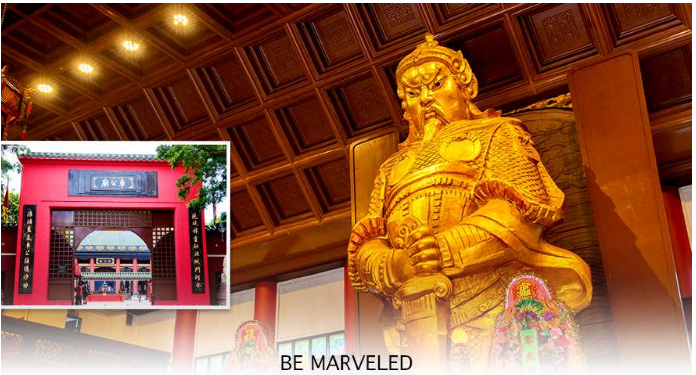
BE MARVELED วัดแชกง

นำท่านเดินทางสู่ วัดแชกงหมิว หรืออีกชื่อหนึ่งว่า “วัดกั๋งหันลม” โดยมีสัญลักษณ์เป็นกั๋งหันนำโชค สร้างขึ้นเพื่อรำลึกถึงท่านแชกงองค์เก่าแก่ มีอายุกว่า 300 ปี ตั้งอยู่ในเขต SHATIN ให้ท่านได้จุดธูปขอพร ลักการะ เทพเจ้า แชกง เป็นอีกหนึ่งวัดที่มีประวัติศาสตร์อันยาวนาน มีตามตำนานเล่ากันว่าได้มีโจรสลัดต้องการที่จะมาปล้นชาวบ้าน เมื่อนายพลแชกงรู้เข้าก็ได้บอกให้ชาวบ้านปักกั๋งหันลมแล้วนำไปติดไว้ที่หน้าบ้าน ปรากฏว่าโจรสลัดได้จากไปและไม่ได้ ทำการปล้น ชาวบ้านจึงมีความเชื่อว่ากั๋งหันลมนั้นช่วยขจัดสิ่งชั่วร้ายที่กำลังจะเข้ามา และนำพาสิ่งดีๆ มาสู่ตน จึงได้ สร้างวัดแชกงแห่งนี้ขึ้น เพื่อระลึกถึงนายพลแชกง และเป็นที่พักการบูชาเพื่อไม่ให้มีสิ่งไม่ดีเกิดขึ้น โดยจะมีวิธีการไหว้ คือ ตั้งจิตอธิษฐานด้านหน้าองค์เจ้าพ่อแชกง จากนั้นให้ท่านหมุนกั๋งหัน จะมีกั๋งหัน 4 ใบพัด แต่ละใบหมายถึงพร 4 ประการ คือ เดินทางปลอดภัย, สุขภาพแข็งแรง, สมความปรารถนา, และ โชคลาภเงินทอง เชื่อกันว่าหากหมุนครบ 3 รอบและตีกลอง 3 ครั้ง ถือว่าเป็นการช่วยหมุนปัดเป่าเอาสิ่งร้ายและไม่ดีออกไปให้หมด และนำพาสิ่งดีๆ เข้ามาแทน