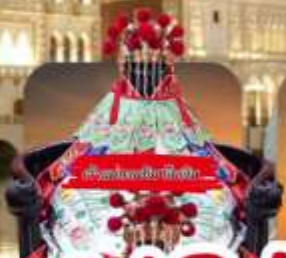
วัดพระทองฮั่งโจ้ว