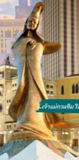
เจ้าแม่กวนอิม ริมทะเล