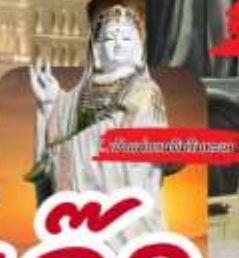
วัดพระทองฮั่งโจ้ว