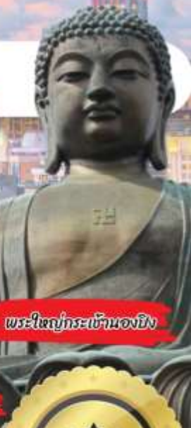
พระใหญ่กระเขมของยิ่ง