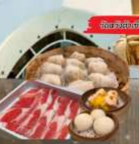
จัดของว่างแถม