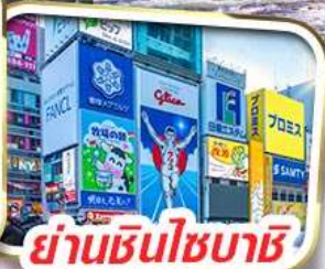
ย่านชินโซบะชิ