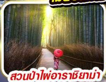
สวนป่าไฟอาราชิยาม่า