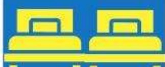
ห้องพักเตียงคู่ TWIN