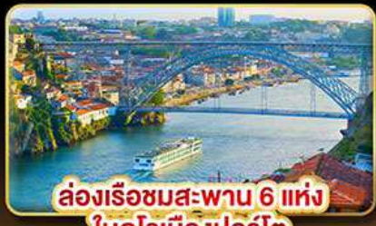
ล่องเรือชมสะพาน 6 แห่ง ในคูโรเมืองปอร์โต