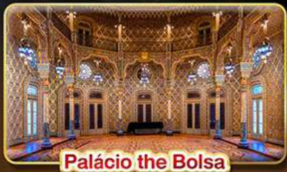
Palácio the Bolsa