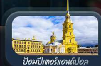
ป้อมปีเตอร์แอนด์ปอล

highlight สองเมืองไฮไลท์ของรัสเซียที่ไม่ควรพลาด! ตื่นตาตื่นใจกับมหาวิหารเซนต์บาซิล ชมความยิ่งใหญ่ของจัตุรัสแดง สัมผัสอดีตที่พระราชวังเครมลิน ชมความงามของสถานีรถไฟใต้ดินมอสโก ชาร์กอร์ส โบสถ์ไอสิกรีนดี เป็นเขาสเปร์โรวให้คุณได้สัมผัส ชมความงามพระราชวังฤดูหนาว พิพิธภัณฑ์ฮอร์มีทาจ ป้อมปีเตอร์แอนด์ปอล และมหาวิหารเซนต์ไอแซค