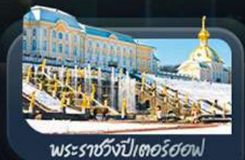
พระราชวังปีเตอร์ฮอฟ