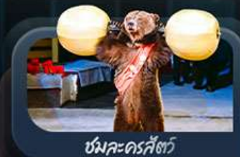
ชมละครสัตว์