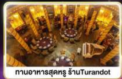
ทานอาหารสุดหรู ร้านTurandot