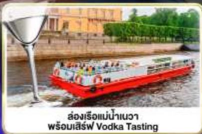
ล่องเรือแม่น้ำวอวา พร้อมเสิร์ฟ Vodka Tasting