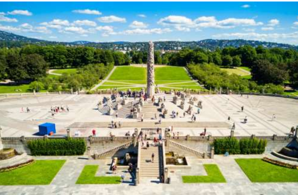
อุทยานฟรอกเนอร์ (Frogner Park)

นำท่านเดินทางสู่ อุทยานฟรอกเนอร์ (Frogner Park) สวนสาธารณะขนาดใหญ่ใจกลางกรุงออสโล จากนั้นนำท่าน เข้าชม สวนประติมากรรมวิกเกอลันด์ (Vigeland Sculpture Park) ถือเป็นสวนประติมากรรมกลางแจ้งที่ใหญ่ที่สุดในโลก ผลงานศิลปะกลางแจ้งอันยิ่งใหญ่ของ กุสตาฟ วิกเกอลันด์ (Gustav Vigeland) ปฐมกรเอกชาวนอร์เวย์ ผู้ใช้เวลากว่า 40 ปีในการสร้างสรรค์ผลงานอันทรงคุณค่า ท่านจะได้ชมประติมากรรมที่สื่อถึง “วัฏจักรชีวิตมนุษย์” ตั้งแต่วัยเยาว์จนถึงชรา ถ่ายทอดผ่านงานแกะสลักหินแกรนิตและรูปหล่อทองแดงจำนวนกว่า 200 ชิ้น กระจายอยู่ทั่วบริเวณสวนจุดเด่นของอุทยานคือ ประติมากรรม “โมนอลิธ” (Monolith) เสาหินแกรนิตขนาดมหึมาสูง 17 เมตร ที่แกะสลักลดหลั่นร่างมนุษย์จำนวนมากขึ้นสู่ยอดเสา อันเป็นสัญลักษณ์ของความเชื่อมโยงและการเติบโตของชีวิตมนุษย์