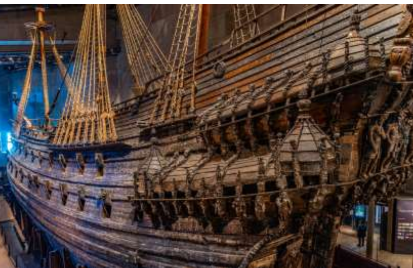
พิพิธภัณฑ์เรือวาซา (Vasa Museum)

จากนั้นนำทุกท่านเข้าสู่ เข้าชมชม ศาลาว่าการเมืองสต็อกโฮล์ม (Stockholm City Hall) ซึ่งเป็นสถานที่จัดงานเลี้ยงอันทรงเกียรติสำหรับผู้ได้รับรางวัลโนเบลที่มีชื่อเสียงไปทั่วโลก พิธีมอบรางวัลโนเบลจะจัดขึ้นในเดือนธันวาคมของทุกปี ตัวอาคารแห่งนี้สร้างขึ้นจากอิฐแดงกว่า 8 ล้านก้อน ใช้เวลาก่อสร้างยาวนานถึง 12 ปี แล้วเสร็จในปี ค.ศ. 1911 ภายในอาคารมีห้องโถงที่ตกแต่งอย่างงดงาม โดยเฉพาะ “ห้องเต็นร์รา” ที่ประดับผนังด้วยลวดลายหินโมเสกกว่า 19 ล้านชิ้น จากนั้นนำคณะเดินทางเข้าสู่ การเข้าชม พิพิธภัณฑ์เรือวาซา (Vasa Museum) ซึ่งจัดแสดงเรือรบ “วาซาร์” (Vasa) เรือรบประจำราชอาณาจักรสวีเดนที่ได้รับพระราชโองการให้สร้างขึ้นเพื่อใช้ในการสงครามกับเยอรมนี ถึงแม้จะได้รับการสร้างขึ้นอย่างวิจิตรและทรงพลัง แต่เรือลำนี้ก็กลับจมลงสู่ก้นทะเลบอลติกภายในเวลาเพียง 30 นาที หลังการปล่อยลงน้ำและจมอยู่นานถึง 333 ปี ก่อนจะได้รับการกู้ขึ้นมาและจัดแสดงให้ชมในพิพิธภัณฑ์แห่งนี้ได้อย่างสมบูรณ์