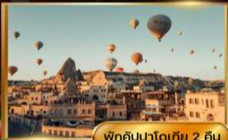
พิกल्पาโดเกีย 2 คืน