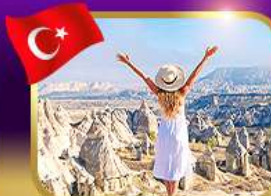
ชมความงาม หุบเขาแห่งรัก