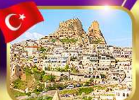
หุบเขาอูชิซาร์ คัปปาโดเกีย