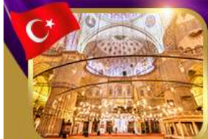
เข้าชมความงามสุเหร่าสีน้ำเงิน