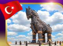
ม้าไม้เมืองกรอย ซานิคคาล