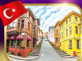
ชมบ้านหลากสีย่านบาลีก