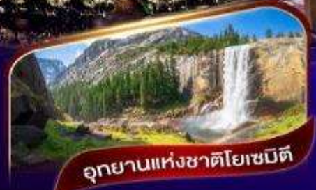
อุทยานแห่งชาติโยเซมิตี