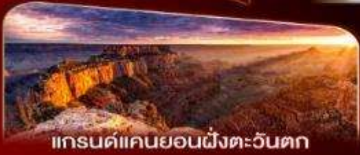
แกรนด์แคนยอนฝั่งตะวันตก

พักลาสเวกัส 2 คืน เต็มอิ่มกับแสงสีแห่งอเมริกา