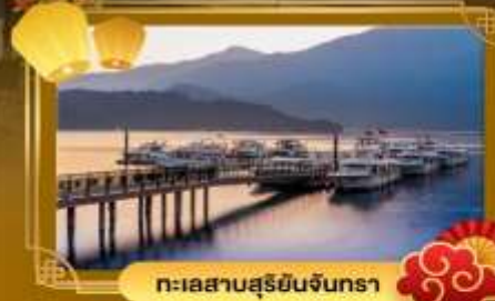
ทะเลสาบสุริยอินจันตรา