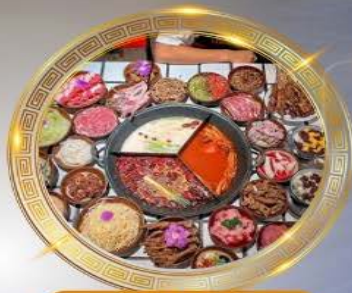
บุฟเฟ่ต์มือโหลงซิ่ง