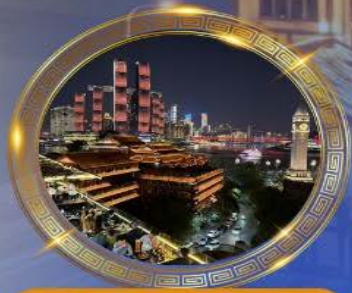
มือคำร้านอาหารวิวหลักล้าน