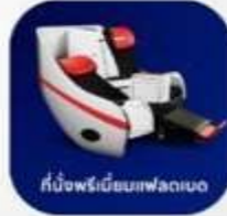
ที่นั่งพรีเมียมเฟลทเบด