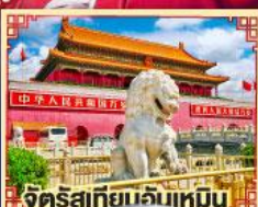
จัตุรัสเทียนจันเหมิน