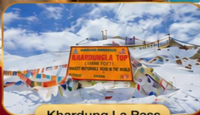
Khardung La Pass