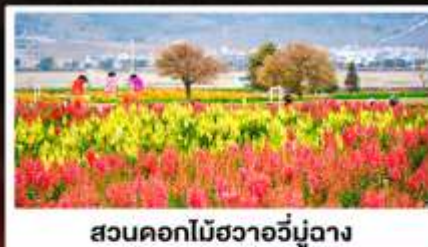
สวนดอกไม้ฮัวอวี่มู่ฉาง