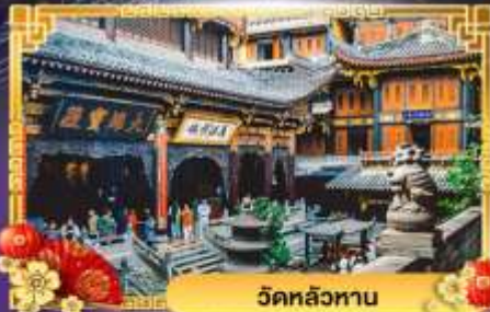
วัดหลิวทาน