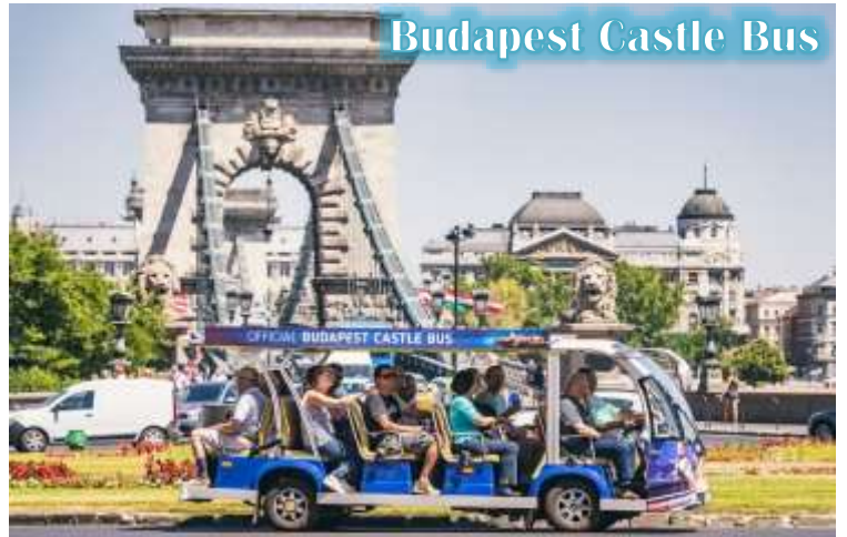
Budapest Castle Bus

บูดา Castle Hill *เนื่องจากตัวปราสาทตั้งอยู่บนเนินเขา การเดินทางโดยรถไฟไฟฟ้า จะเพิ่มความสะดวกสบายให้กับท่าน โดยรถไฟไฟฟ้าจะจอดรับและส่งตามจุดต่างๆ ในย่านเมืองเก่า ไม่ต้องเดินเท้าเป็นระยะทางไกล* จากนั้นนำท่านเดินชมความงดงามของเมืองเก่ารอบๆปราสาทบูดา ที่เริ่มมีการก่อสร้างมาตั้งแต่ปี ค.ศ.1265 และต่อเติมปรับปรุงมาโดยตลอด จนกระทั่งปัจจุบัน โดยตัวอาคารในปัจจุบันเราจะเห็นเป็นสไตล์บาโรค ที่ดู