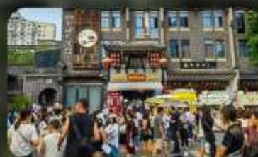
ถนนชอยกวางชอยแคบ