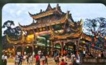
เมืองโบราณกวนเสี้ยน