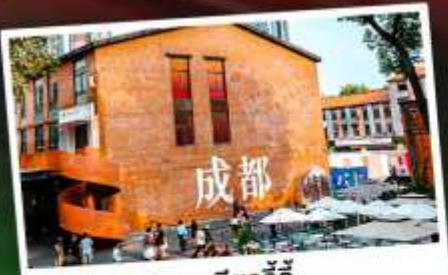
ตงเจียวจี้

เทือกเขาแอลป์แห่งเมืองจีน ชมความงามของ "อุทยานภูเขาสิ่วครุณี"