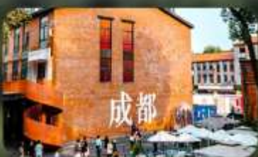
ดงเจียวจี้

HOLIDAY INN EXPRESS HOTEL หรือเทียบเท่า 4 คาว