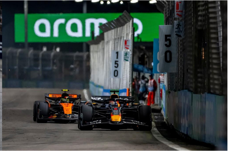
ชม รอบ SPRINT RACE + QUALIFYING