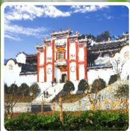
บ้านเกิดชวีหยวน