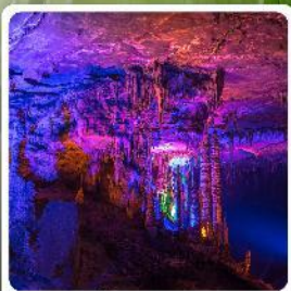
ดำก้ำกัฟ