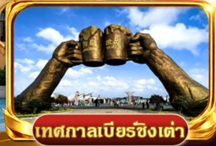
เทศกาลเบียร์ชิงเต่า