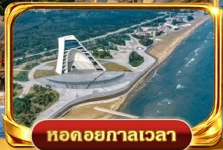
หอดอยกาลเวลา