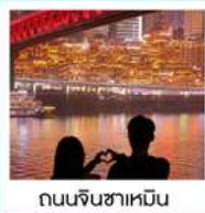
ถนนจินซาเหมิน