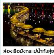
ห้องเรือมังกรแม่น้ำก้งซุย