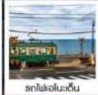
รถไฟโอโนะเด็น