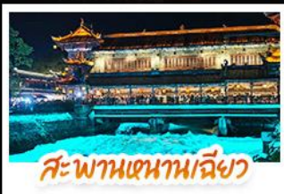
สะพานเทียนเฉียว