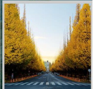
“ICHONAMIKI GINGO AVENUE”