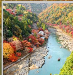
“ARASHIYAMA MT. KAMEYAMA”