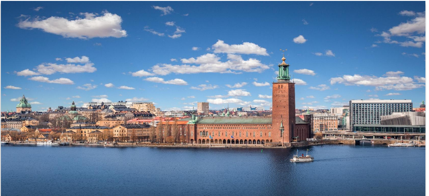
STOCKHOLM CITY HALL

จากนั้นนำทุกท่านชม ศาลาว่าการเมืองสต็อกโฮล์ม (Stockholm City Hall) ซึ่งเป็นสถานที่จัดงานเลี้ยงอันทรงเกียรติสำหรับผู้ได้รับรางวัลโนเบลที่มีชื่อเสียงไปทั่วโลก พิธีมอบรางวัลโนเบลจะจัดขึ้นในเดือนธันวาคมของทุกปี ตัวอาคารแห่งนี้สร้างขึ้นจากอิฐแดงกว่า 8 ล้านก้อน ใช้เวลาก่อสร้างยาวนานถึง 12 ปี แล้วเสร็จในปี ค.ศ. 1911 ภายในอาคารมีห้องโถงที่ตกแต่งอย่างงดงาม โดยเฉพาะ “ห้องต้นรำ” ที่ประดับผนังด้วยลวดลายหิน