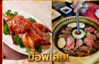
เปิดอย่างฮ่องกง บุฟเฟ่ต์ปิ้งย่างเกาหลี